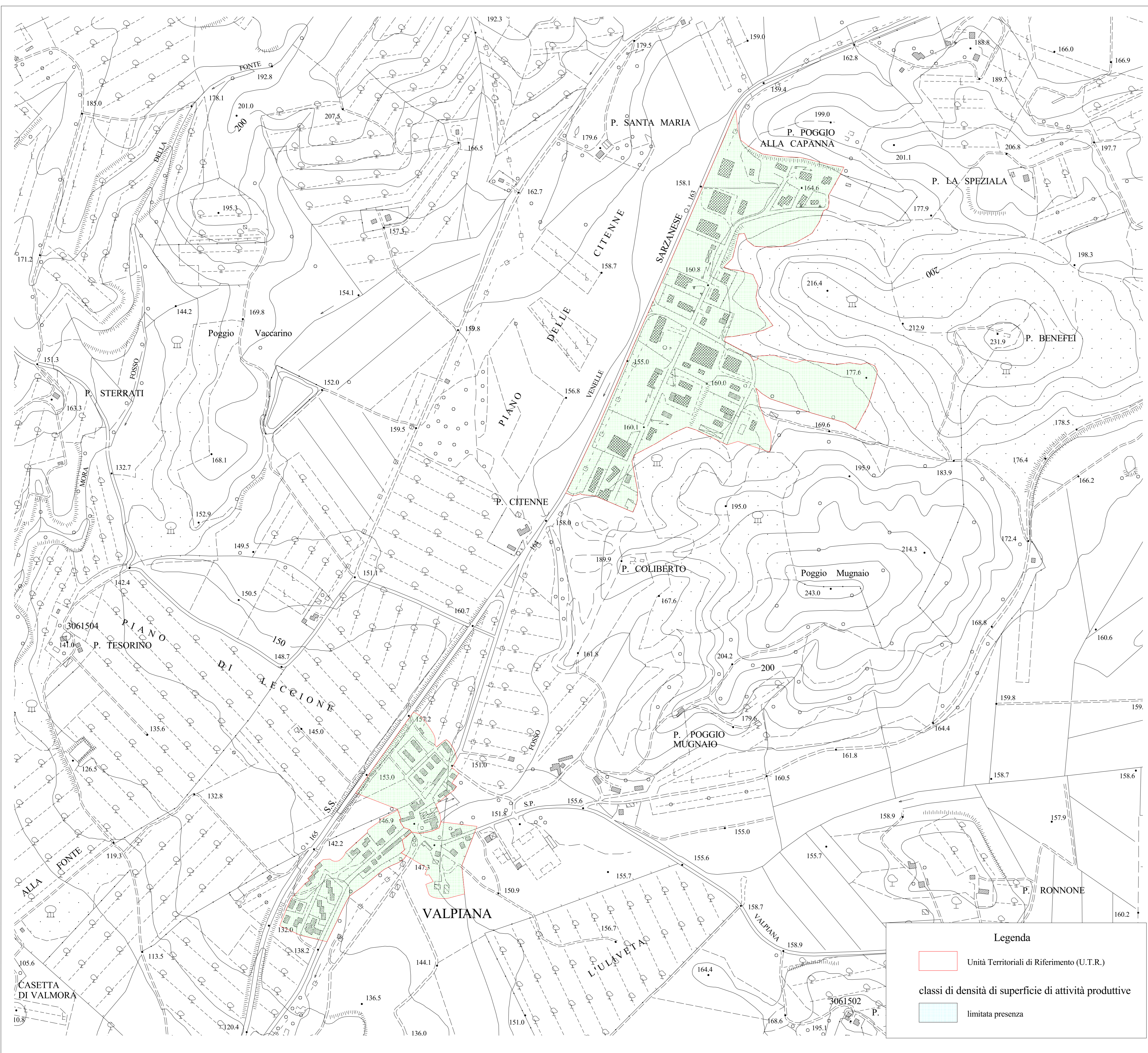
Quadro di unione delle aree coperte dalle Unità Territoriali di Riferimento